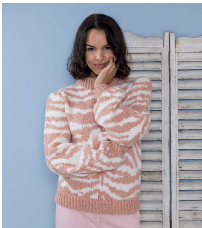
Prøv genseren i pudderrosa | DSA78-02