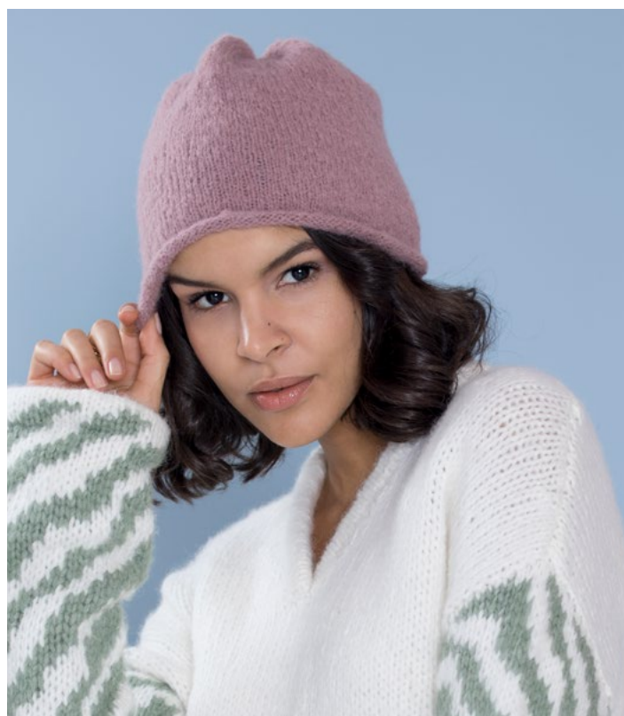
Prøv luen i rose | DSA78-07