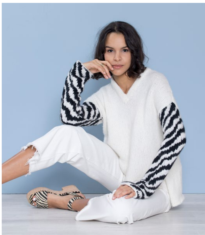
Se oppskrift på genser | DSA78-06