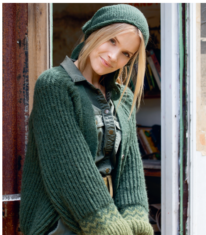
Prøv jakken i grønn | DSA80-04