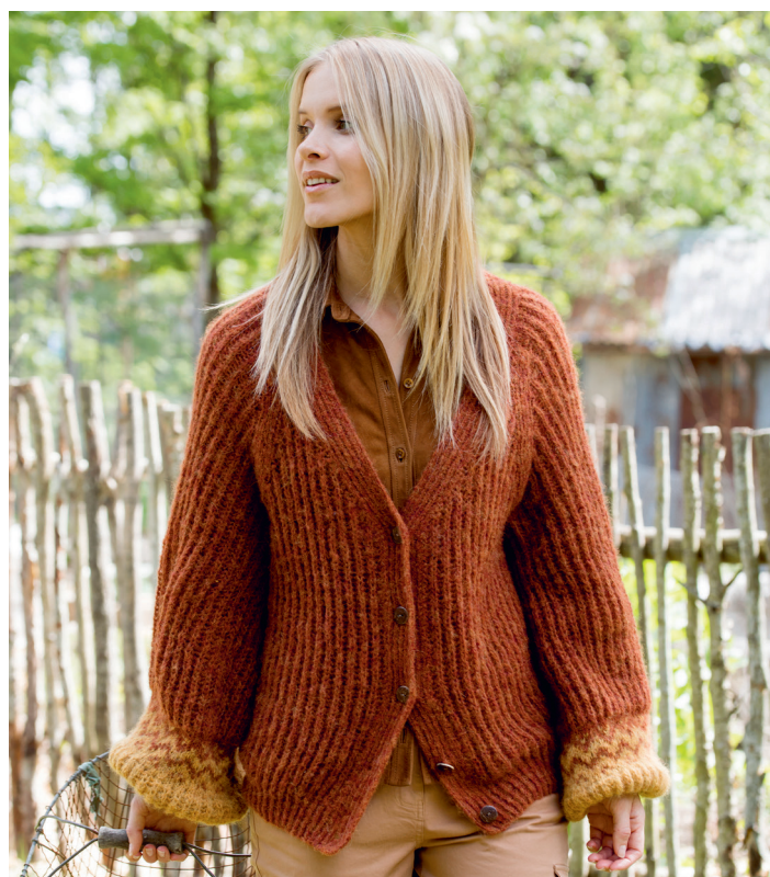
Prøv jakken i rust | DSA80-03