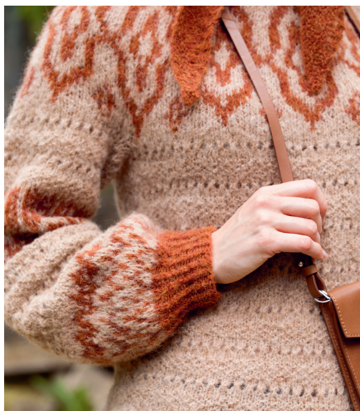
Prøv genseren i kamel | DSA80-07