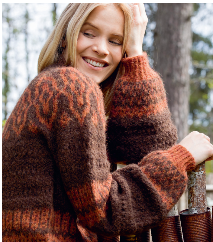
Prøv genseren i brun | DSA80-05