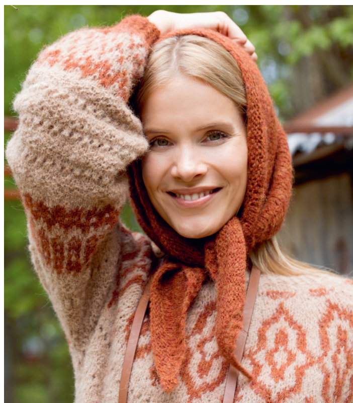
Prøv skjerfet i rust | DSA80-08