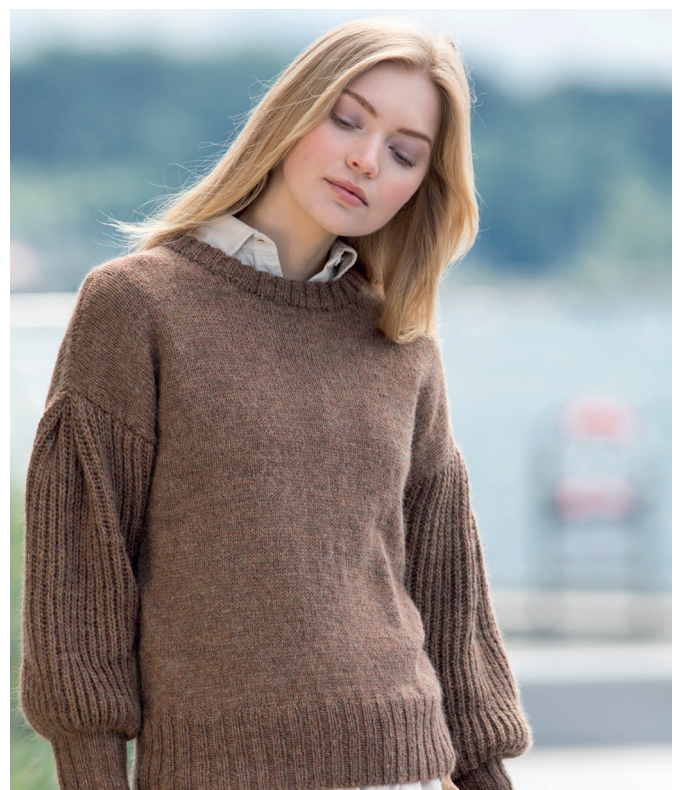
Prøv den i varmbrun | DSA 81-01