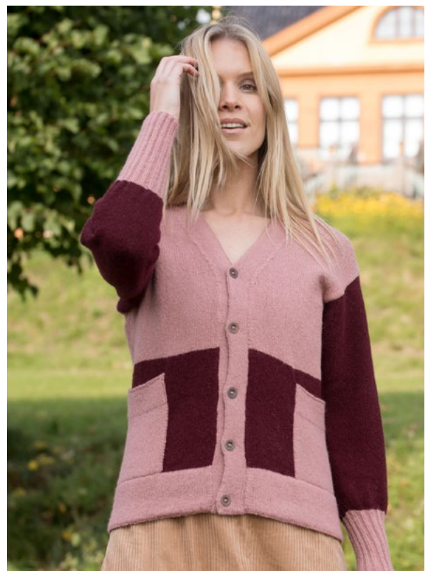
Prøv den i dus rose | DSA 84-01