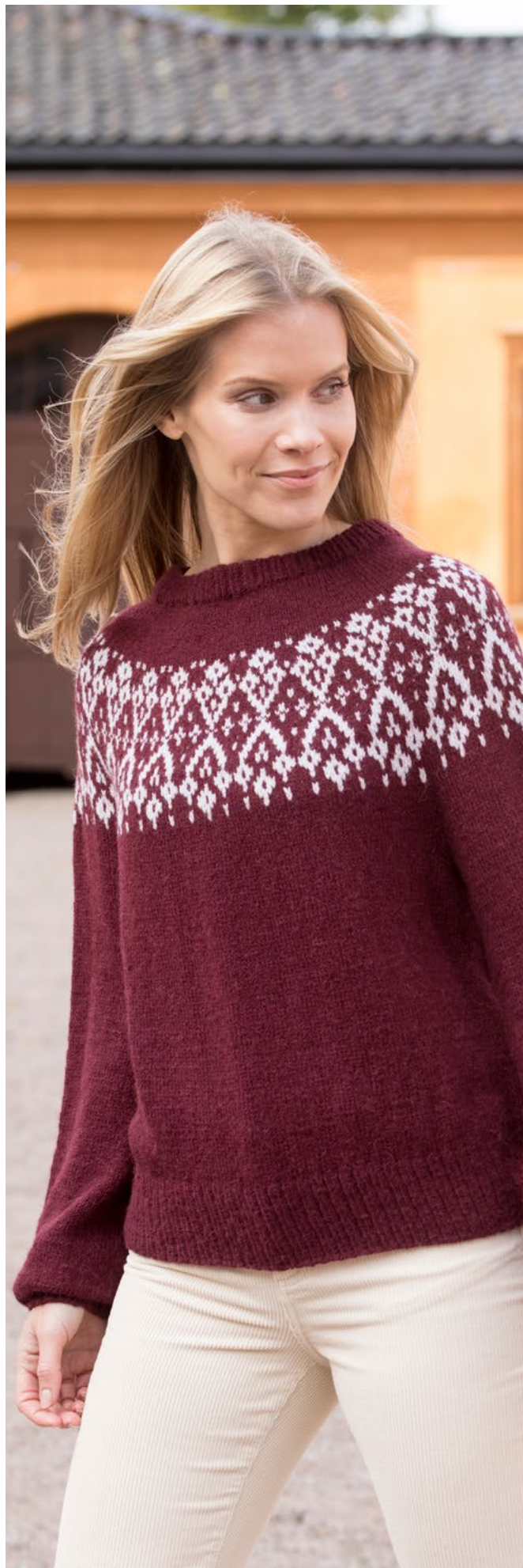
Stylist: Jan Gunnar Svenson @stylesvenson

Kopiering og publisering av materiale og oppskrifter, eller bruk av dette i næringsøyemed, er ikke tillatt uten avtale med House of Yarn AS.