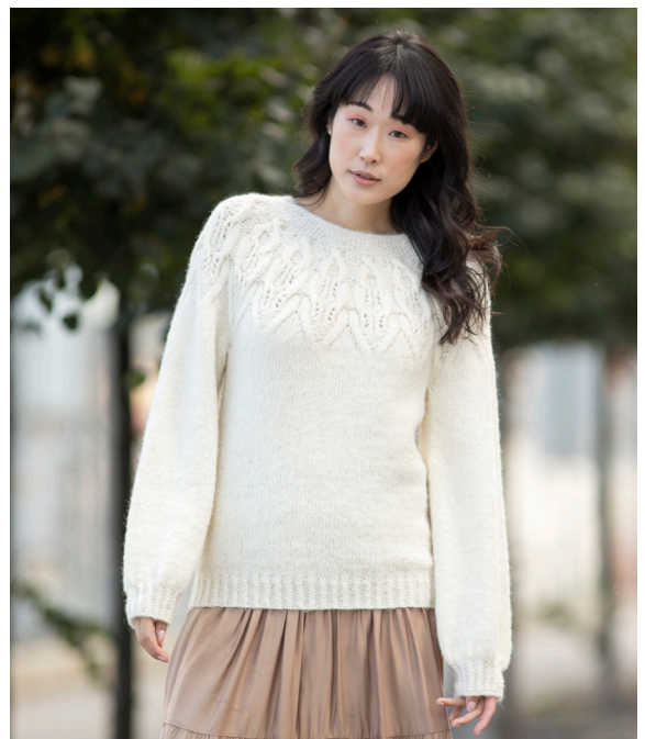
Prøv den i natur | DSA 85-03