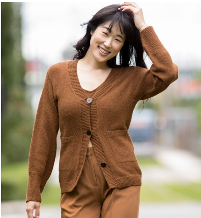
Se oppskrift på cardigan | DSA87-01