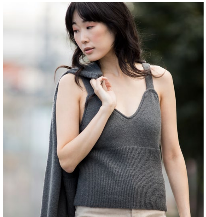
Prøv den i antrasitt | DSA87-04