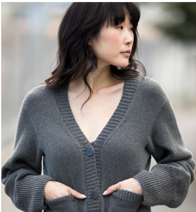
Se oppskrift på cardigan | DSA87-03