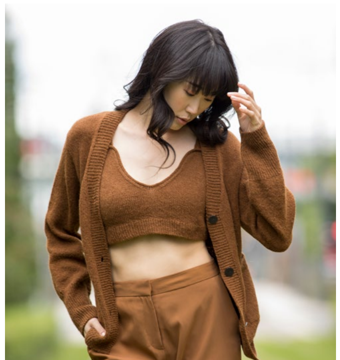
Prøv bralett i varm brun | DSA87-02