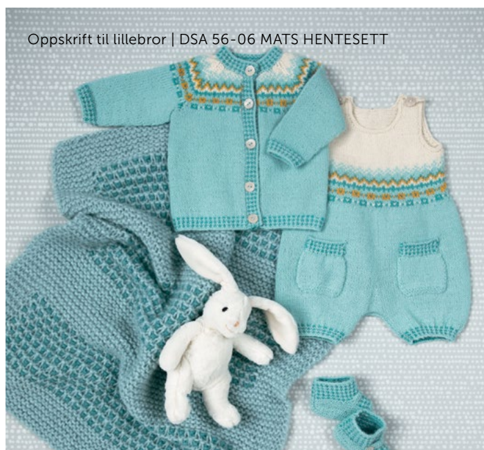
Oppskrift til lillebror | DSA 56-06 MATS HENTESETT