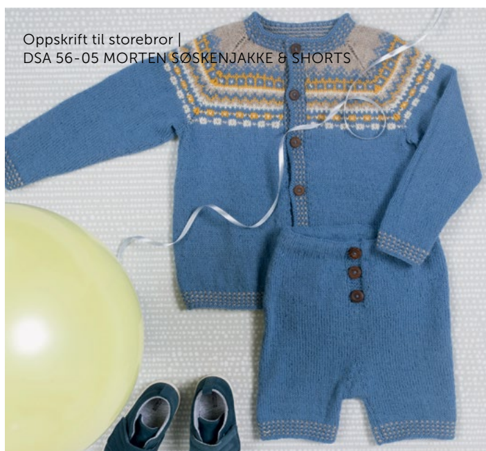
Oppskrift til storebror | DSA 56-05 MORTEN SØSKENJAKKE & SHORTS