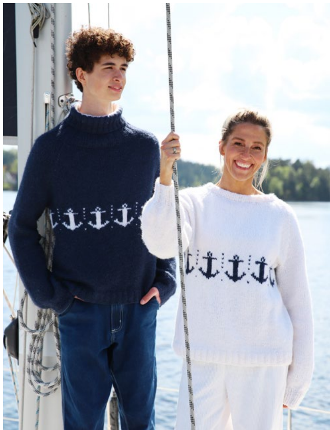
For oppskrift på genseren i marine se GD 02-11