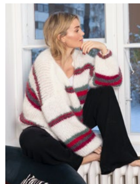
Se også CP10-02 DANDELION