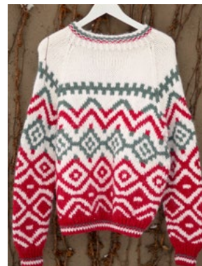
Se også CP10-01 BLUEBELL