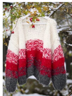
Se også CP10-04 CROCUS