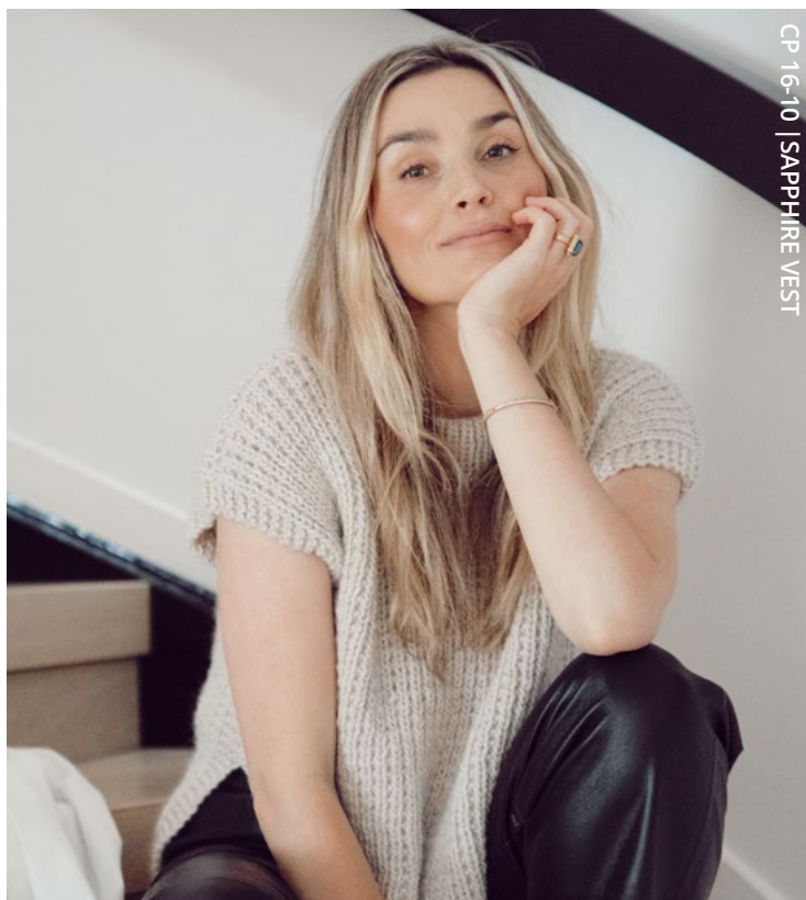
CP 16-10 | SAPPHIRE VEST