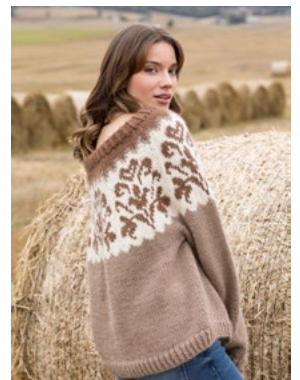
Se også CP07-12 HONEYSUCKLE OLAVA Kamel 905, Moskus 921, Natur 903