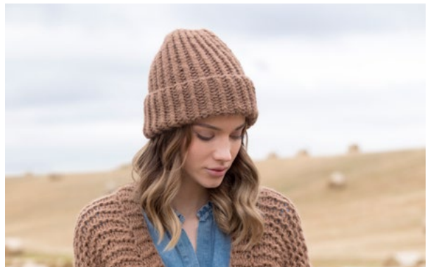
Se også CP07-23 COSMOS PIHLROS Kamel 905