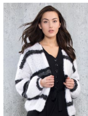
Se også CP08-12 DANDELION FNUGG Svart 901, Koks 918, Hvit 902