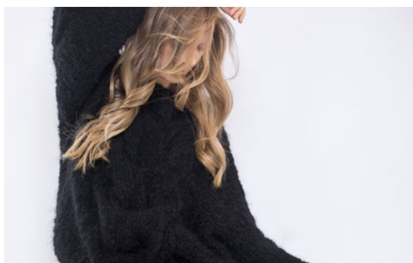
Se også CP08-10 CAMELIA FNUGG Svart 901