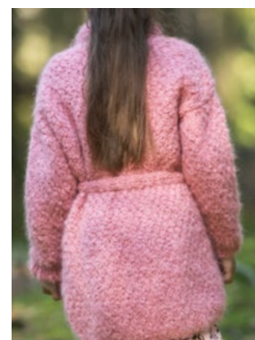
Se også CP09-08 JASMINE KIDS FNUGG Myk korall 910