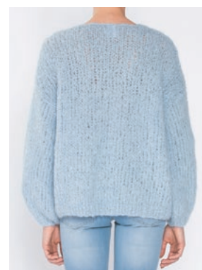
FNUGG Himmelblå 904