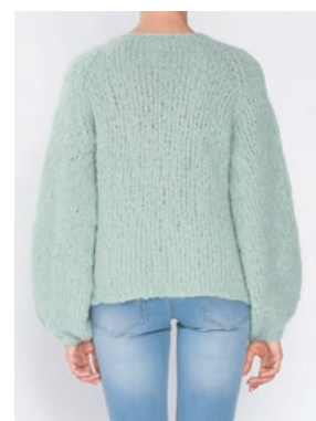
FNUGG Jadegrønn 913