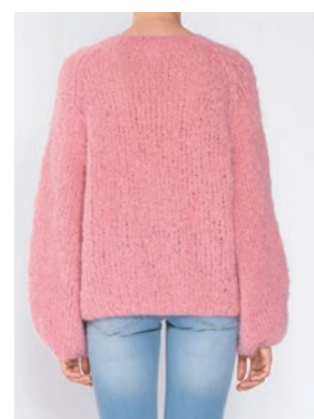
FNUGG Myk korall 910