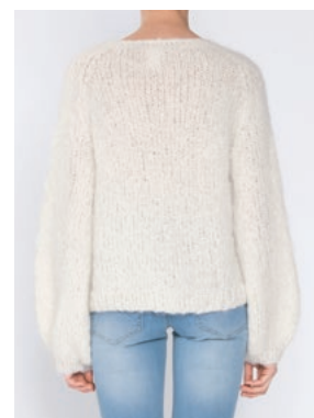
FNUGG Hvit 902