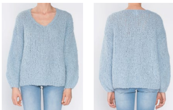
FNUGG Himmelblå 904