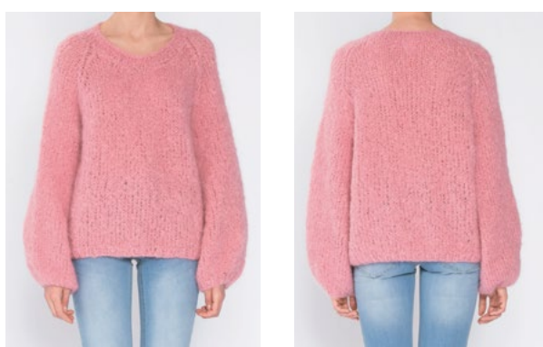
FNUGG Myk korall 910