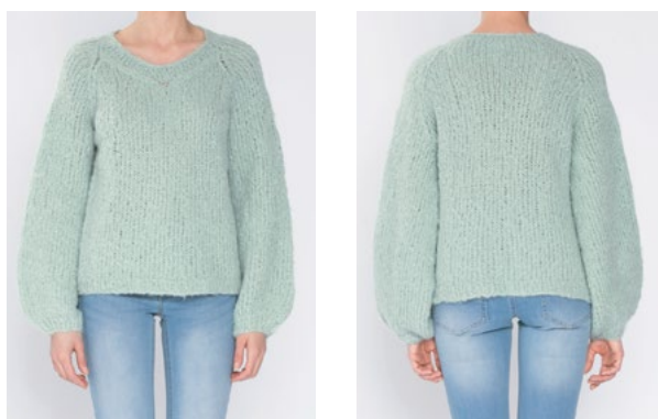
FNUGG Jadegrønn 913

Finner du ikke garnet og fargene i din nærbutikk? Da kan du bestille CAMILLA PIHL-garn direkte via link i oppskriftene og i fargekartene.