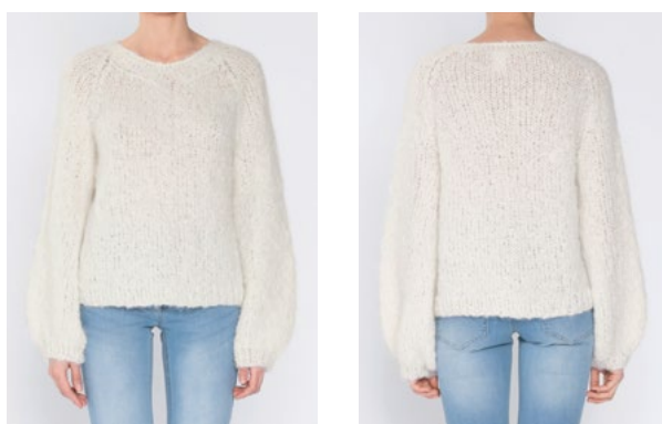
FNUGG Hvit 902