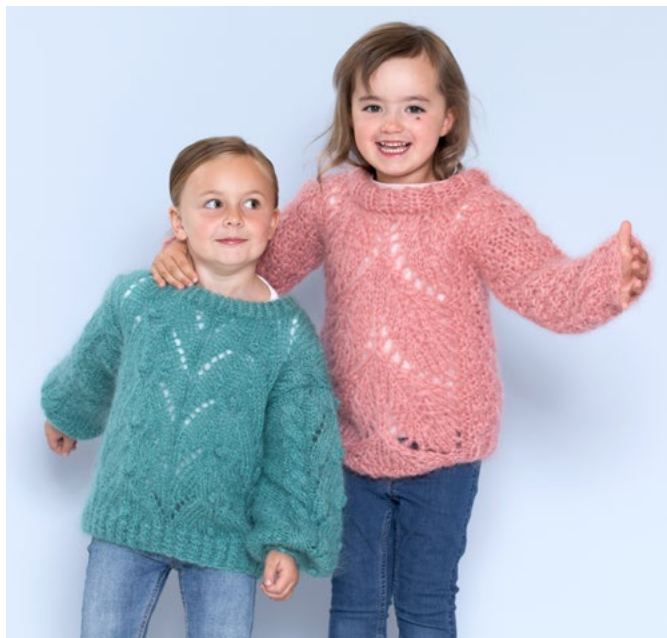
Genser i lys sjøgrønn | DG 395-16

Strikk med denne inndelingen til arbeidet måler ca 26 (29) 32 (35) 38 (39) cm. Fell til ermehull i hver side på hver 2. p 1,1 m (likt alle størrelser) = 27 (29) 31 (33) 37 (39) m.