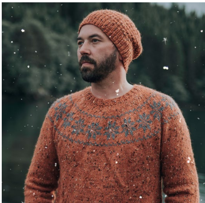
Se også oppskrift på genser | DSA73-09