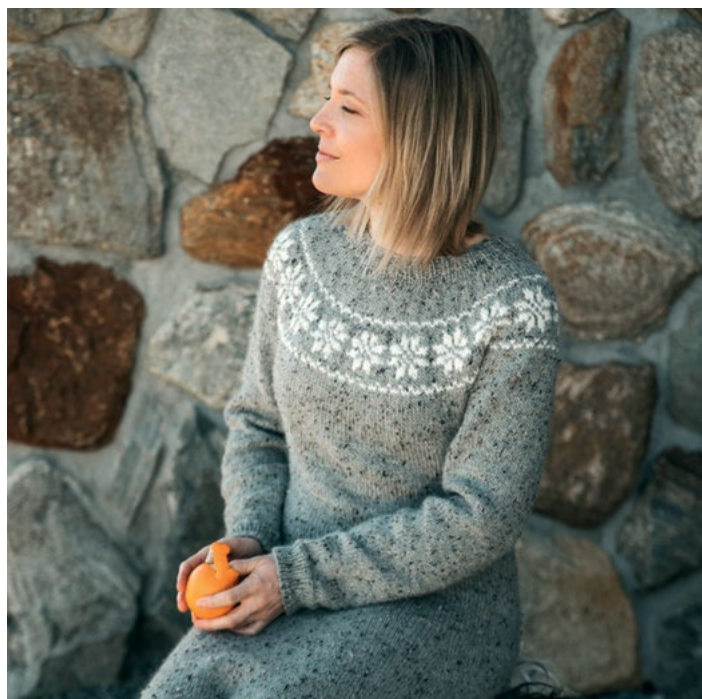
Se også oppskrift på kjole | DSA73-19