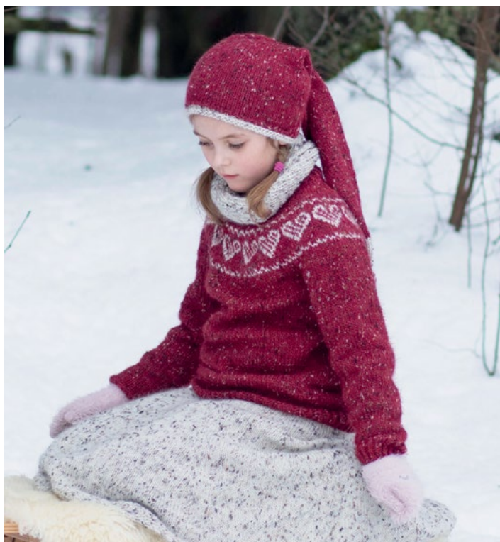
Oppskrift på hjertegenser | DSA73-03