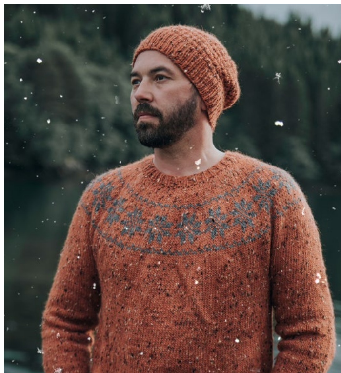
Oppskrift på voksengenser | DSA73-09