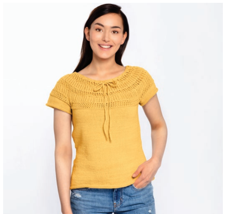
Prøv toppen i gul | GG 19-14