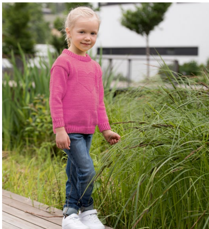
Prøv genseren i rosa | GG19-21