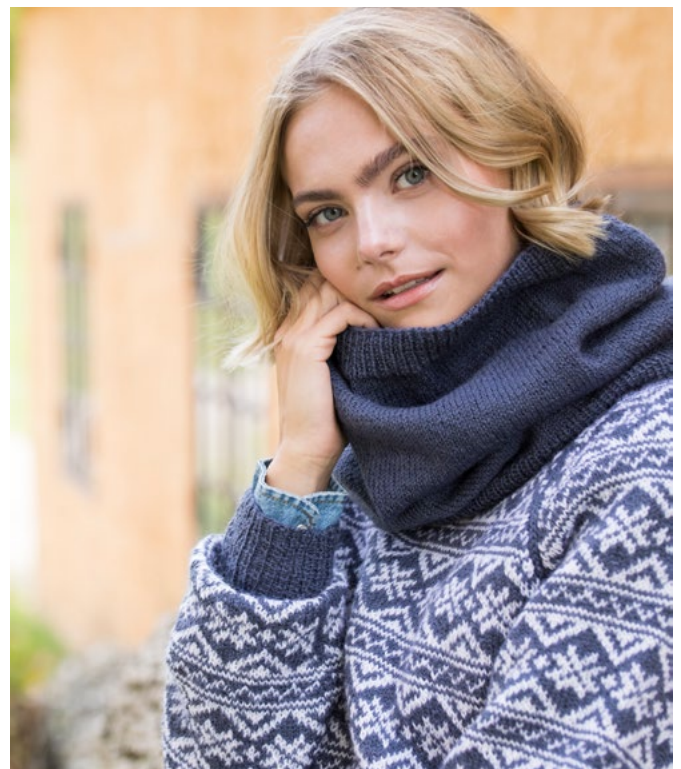
Prøv den i denim | GG278-10