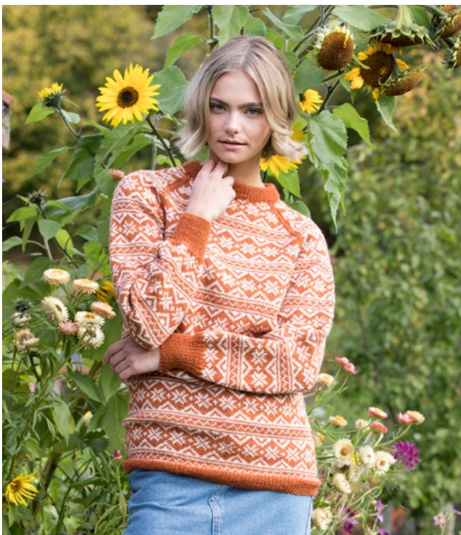
Se oppskrift på genser | GG278-07