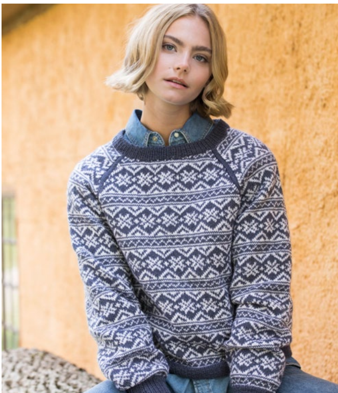
Se oppskrift på genser | GG278-09