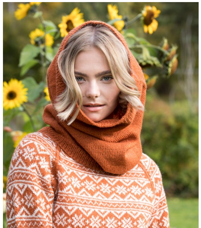
Prøv den i safran | GG278-08