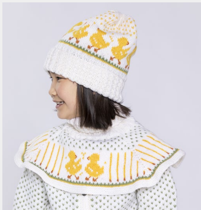
Se oppskrift på Lille kylling tilbehør | EP19-02