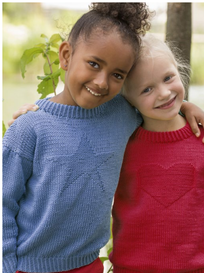
Oppskrift på rød hjertegenser se EP19-30

Sett de avsatte m inn på p nr 3, samtidig som det strikkes opp ca 10 m pr 5 cm over de avfelte m/p rundt halsen. Strikk 5 (5) 5 (6) 6 (6) cm vrangbord rundt med 1 vridd r, 1 vr. Brett kanten dobbel mot vrangen og sy til.